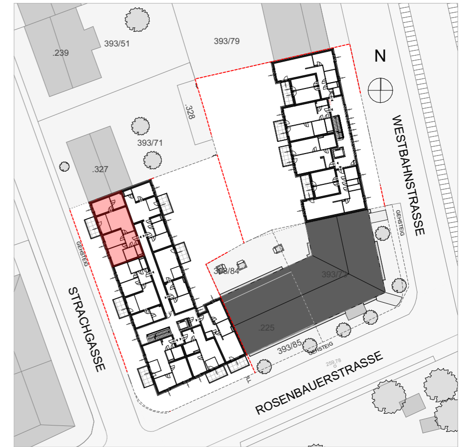
LAGEPLAN | M 1:500