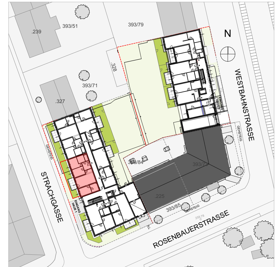
LAGEPLAN | M 1:500