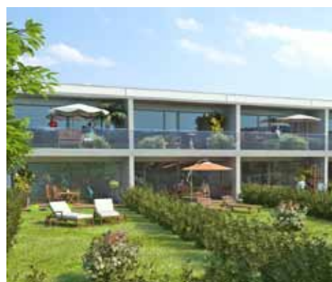
Die Reihenhäuseroffensive in Leonding wird aufgrund des durchschlagenden Erfolges fortgesetzt